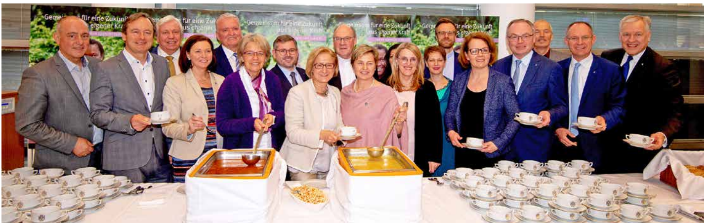
Landeshauptfrau Johanna Mikl-Leitner (Bildmitte), Mitglieder der Landesregierung und weitere Teilnehmer beim traditionellen Benefiz-Suppenessen im NÖ Landhaus.